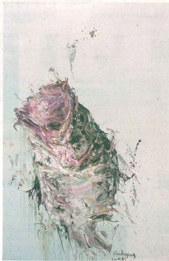
肖克剛《魚2008》，300 x 200cm，布面油畫，2008年

攪住時代脈搏，立足於本土文化和深厚的傳統，從而創造出具有精神深度的當代藝術品。筆者曾在《沒有雷曼兄弟的ART HK 09》一文中提到：「中國當代藝術的價值觀應該表達一種人文關懷，對真正的精神世界有一種探掘。在藝術語言上，不是簡單地照搬西方藝術語言，應該與中國藝術傳統有一種內在聯繫，與中國當下社會及文化有一種呼應。在畫作內容上，能為社會提供一種人格力量……長遠而言，藝術市場行情，最終還是取決於藝術創作自身價值，這是其他條件無法取代的。」