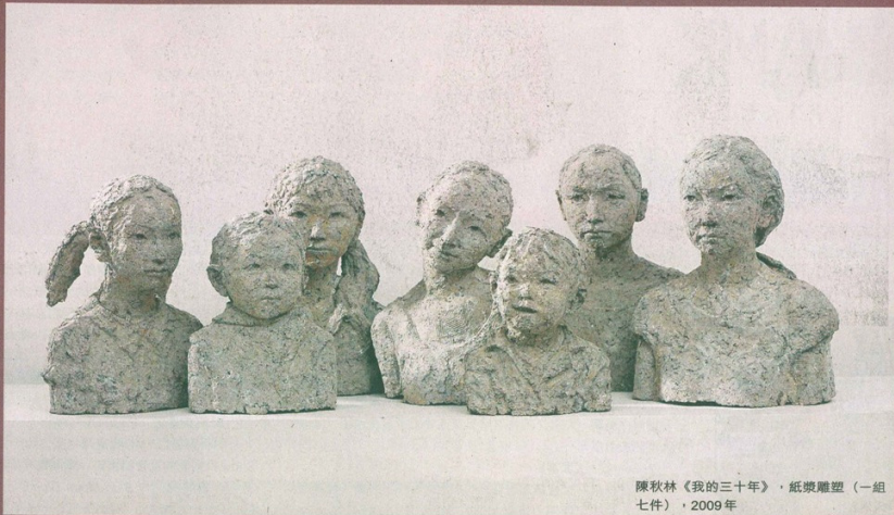
陳秋林《我的三十年》，紙漿雕塑（一組七件），2009年